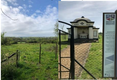
De mooie natuur rondom Tintigny (Afb.1.) Kerk Notre-Dame de l'Assomption (Afb.2.)

Bezienswaardigheden tijdens de wandeling